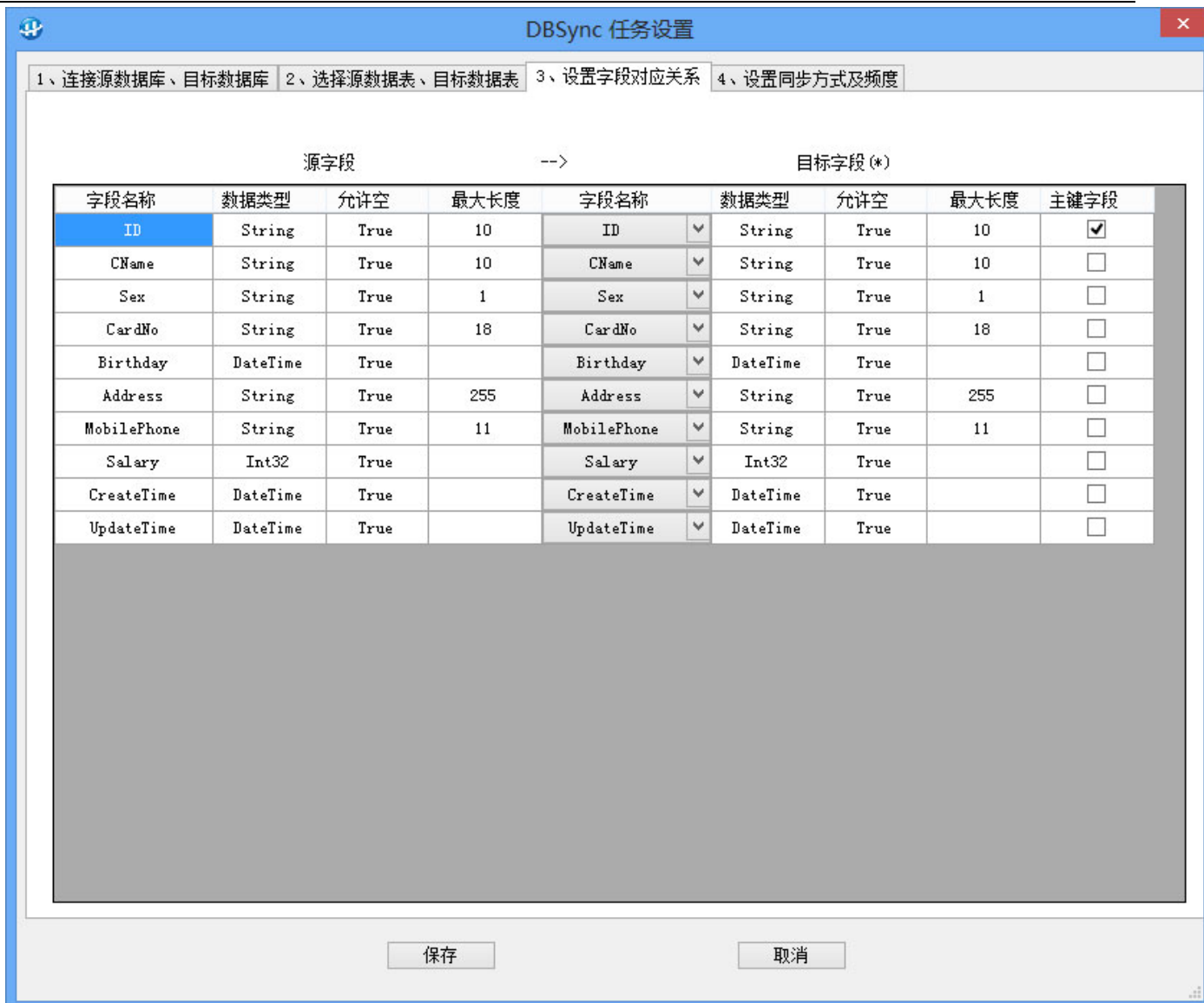
图 5：选择字段对应关系

说明：本界面的用途是设置字段对应关系，即源端字段同步到目标端的哪个字段。如果您需要增量同步，这里必须选择主键字段，主键字段是记录的唯一标识，用于判别同步双方是否存在对应记录。不需要同步的源字段不要选择目标字段，留空即可。