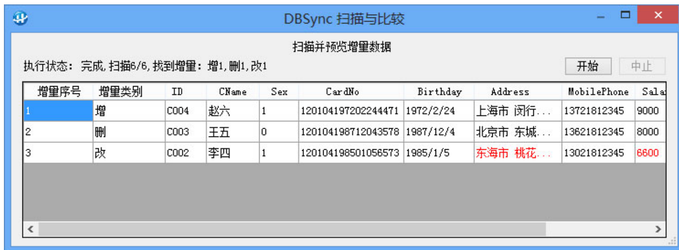
图 7：扫描与比较双方数据

设置好同步任务后，Click 任务列表中的“○”按钮，进入扫描与比较界面，如下图所示：