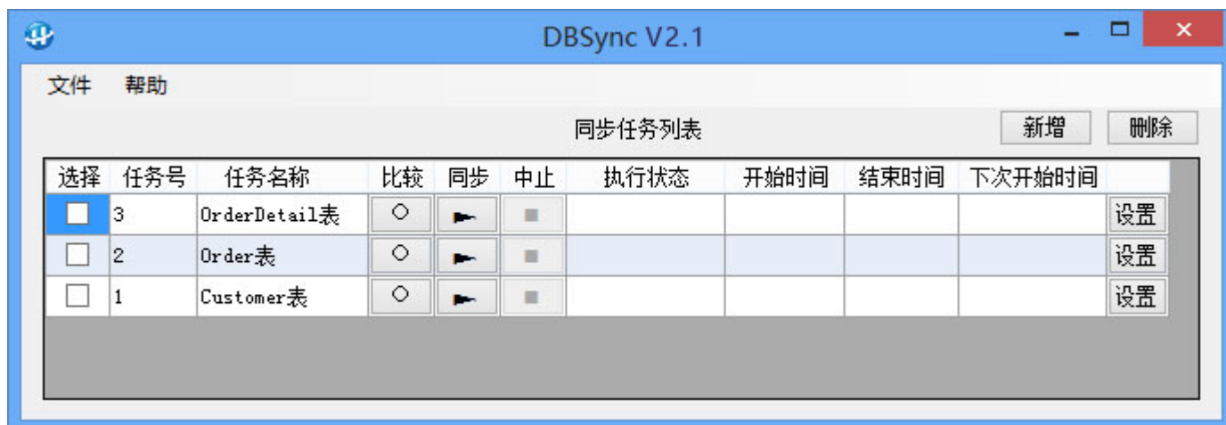
图 2：DBSync 主界面

说明：DBSync 以表为单位进行同步，一个任务负责一对数据表之间的同步，要同步多个表就要设置多个任务，任务可并发执行。主界面的功能介绍如下：